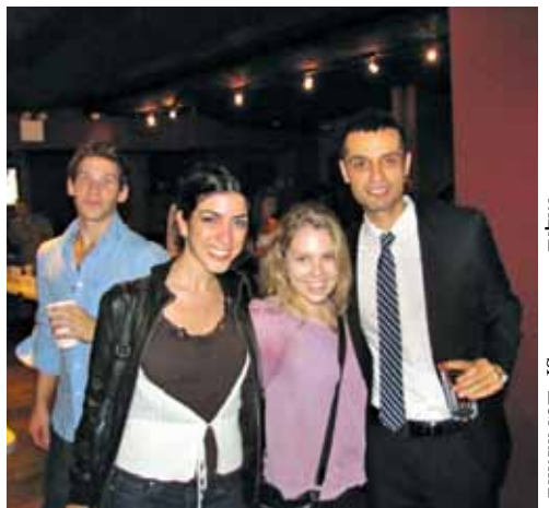
בכיוון השעון מלמעלה: נערכים לשבת, מסיבת רווקים ניו יורקית, דייט בסנטרל פארק