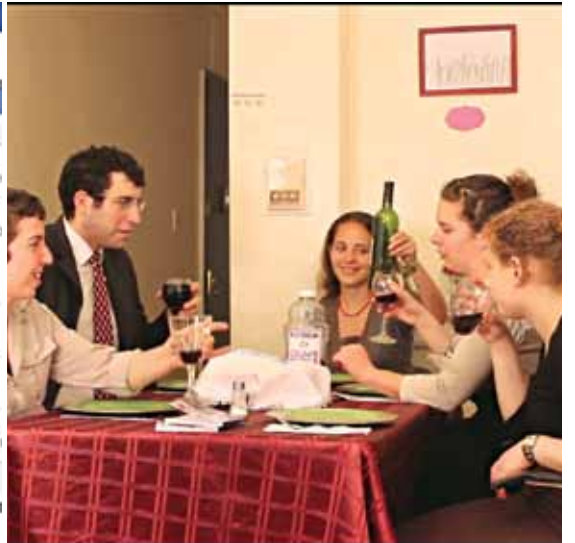
מימין לשמאל: ארוחת שבת בביצה [מתוך הקליפ "פרומים"], הזמנה לסעודה בפייסבוק