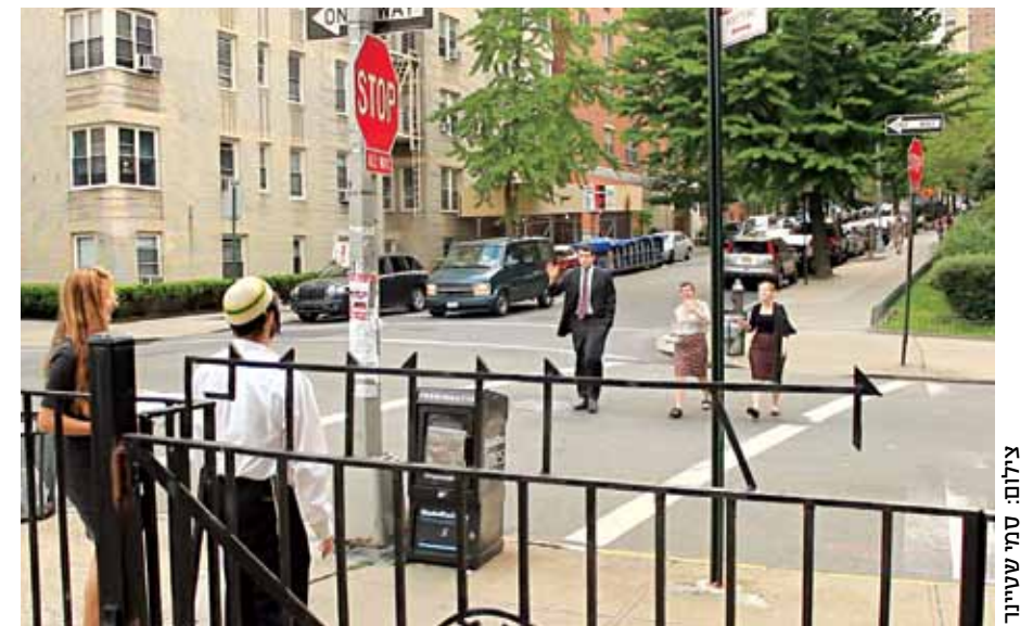
עם פשטידה ויין בדרך לבית הכנסת

במהלך הארוחה היו דיונים רבים, סדרות טלוויזיה חדשות, סרטים והרבה דיבורים על פייסבוק. "שמתם לב שאם לחצתם על כפתור 'Join' באיוונט זה אומר שלא הוזמנתם אבל הצטרפתם בכל זאת?" פתח את השיחה אחד המשתתפים. "באמת?" ענו כולם בחדרה, והתחילו לחשב בכמה אירועים הם השתתפו בלי שהיו מוזמנים. השיחה הלכה והתפתחה, ודיבורים על פיתוחים שונים בפייסבוק עלו וירדו. פתאום נזכרו הנוכחים שבעצם יש כתב ישראלי בחדר שכותב כתבה על הביצה. "אם אתה רוצה להיות בעניינים יש חדר כושר אחד שאליו כולם הולכים, גם אלה שלא ממש בעניין של כושר, אבל רוצים לפגוש בנים או בנות", מסבירה לי אחת המתעמלות. אחד הדברים היותר בולטים בדינמיקה החברתית כאן, הוא שבניגוד למה שקורה בארץ,